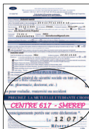
Formulaire Cerfa S 1205g téléchargeable sur smerep.fr , rubrique

1 Pour être affilié à la SMEREP, lors de votre inscription administrative dans votre établissement d'enseignement supérieur, cochez ou indiquez "Centre 617-SMEREP" Qu'il s'agisse d'une inscription papier ou sur Internet, vous trouverez une rubrique dédiée à la Sécurité sociale étudiante.